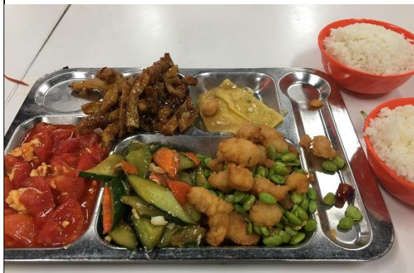
人大食堂豐富的菜色