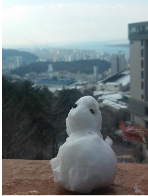
宿舍外與手作雪人