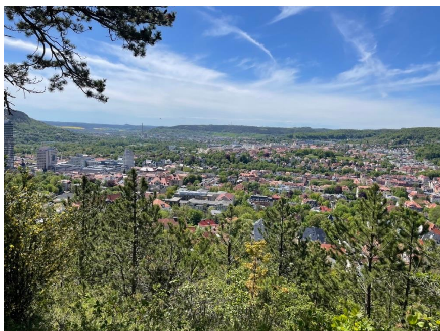
圖：宿舍附近的山丘上

學校位於德國中偏東的位置，假日不論要去 Berlin、Frankfurt 還是 München，搭乘 DB 通常都可以當天來回，不但非常方便還可以省下不少的住宿費。當有較長的假期時，我通常會規劃一趟旅程，去其他附近的國家走走看看並且體驗不同的文化，出發前建議提前一個月先預定好住宿和交通，才不會遇到價錢太貴或是沒有房間的窘境。除了旅遊之外，平常也會跟室友一起下廚、一起在吃晚餐，或是跟朋友去健身房運動，每一項活動對我來說，都是很珍貴、很美好的回憶。